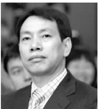
新华都集团董事长陈发树