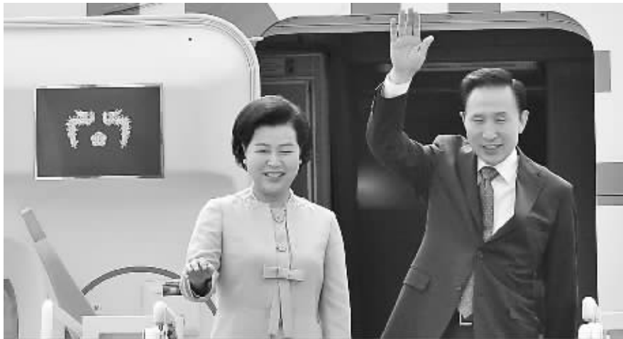
6月15日,李明博在首尔机场向送行人挥手