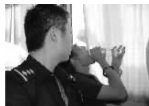
为嫌犯提供矿泉水