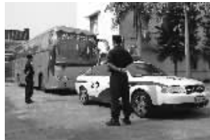
车队从珠海市看守所出发

“绝食的企图可能像‘传染病’一样在嫌疑人中蔓延。”民警事后告诉记者,押解女民警当时将盒饭与矿泉水带上客车,就坐在女嫌疑人身边大口吃喝。2日晚,饥渴难