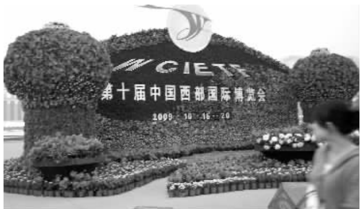
天府广场的鲜花雕塑,营造浓郁的节日气氛

去年第九届西博会上,成都馆成为我市对外招商引资、宣传推广的重要平台。4天展期,共接待中外代表1.2万余人次。南京、樟州等8个城市代表团200多人和海外华商300多人先后到成都馆参观,对成都城乡统筹发展、均衡发展的成就给予高度评价。各区(市)县轮流在成都馆开展招商引资接待工作,接待世界500强等