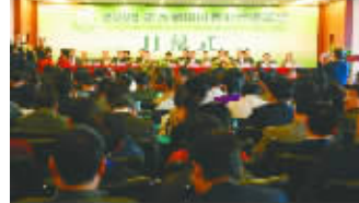
第五届中国茶业经济年会在浦江开幕

昨日，由省人民政府、中国茶叶流通协会主办，成都市人民政府、浦江县政府等协办的“2009第五届中国茶业经济年会”在浦江开幕。为期三天的本届茶业经济年会以“合作、生态、发展”为主题，主要内容包括表彰活动、茶叶专题报告会、茶叶产业发展论坛、产销贸易洽谈会等。在昨日的会议中，我市浦江茶业获得2009全国重点产茶县、全国特色产茶县等殊荣。浦江茶产业引来众与会者的普遍关注。本届茶业经济年会有来自全国各茶叶生产、加工、流通企业、科研院所、茶叶团体代表，各产茶地市、县政