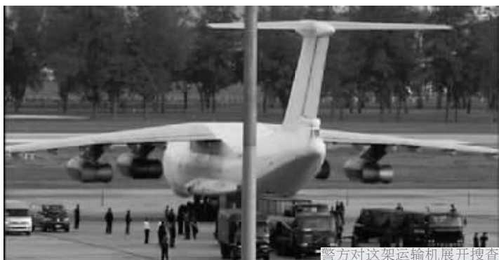
警方对这架运输机展开搜查

阿披实13日表示,5名周六在曼谷扣押的朝鲜飞机机组人员将被起诉。据此间媒体报道,12日,一架来自朝鲜的运输机在曼谷廊曼国际机场降落加油时被扣押,原因是该机运载有35吨各类重型武器,包括导弹发射管、地对空高射炮部件、大型炮弹、RPG火箭发射器等。泰国警方逮捕了机上5名机组人员,其中1人为白俄罗斯籍,另4人为哈萨克斯坦籍。