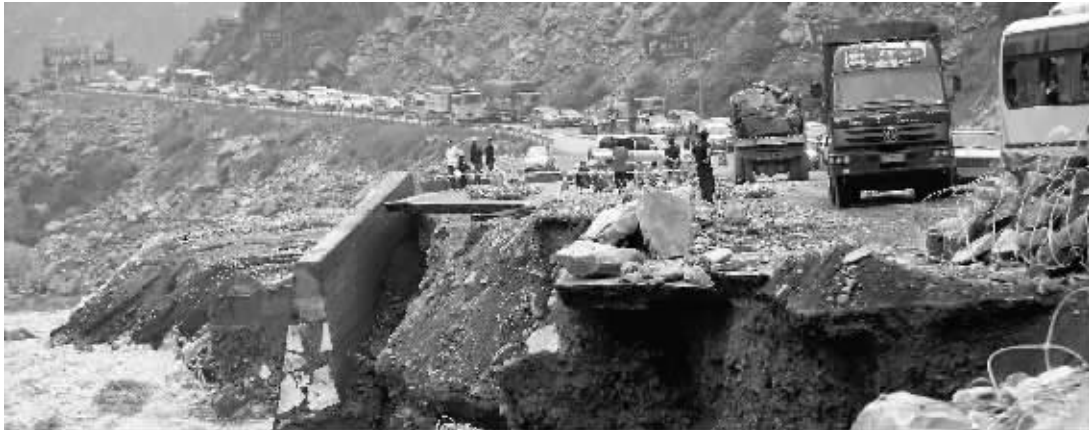
汶川“生命线”(老虎嘴段)昨日暂时中断