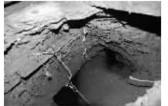
成华街9号道路出现漏洞

爆料人 李先生 40元 本报记者 陈悦 实习生 王红强 昨晚11时30分报道