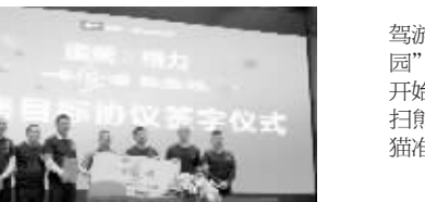
及机型，也足够震撼，大1P变频挂机低至2599元，大1.5P 1级能效领跑者挂机低至3699元，还有全川首发的大2P智能柜机首次发售仅需6599元，更有格力大松空气净化器、晶弘冰箱等格力全品类钜惠。活动期间购机的用户，还能获得格力至臻服务会员卡一张，可享受空调10年免费包修，2年免费包换，以及一年内同城免费移机和空调免费清洗各一次。

近日，N.Paia恩派雅全国巡展首站在成都王府井科华店完美落幕。此次展览延续2017秋冬秀主题，以“重置”概念设计的展厅，借由玻璃和灯光打造出一个充满未来感的装置空间，置身其中犹如置身神秘宇宙。N.Paia恩派雅始终将“重置”这一概念贯穿至每一件产品之中，