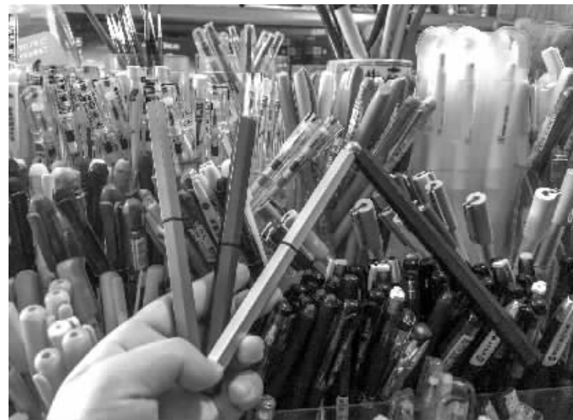
磁性笔备受小学生青睐