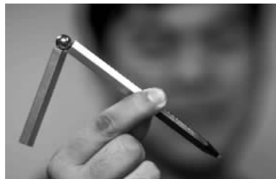
磁性小球与笔筒有安全隐患