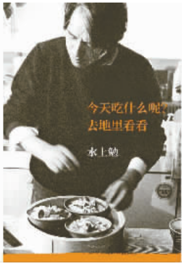
《今天吃什么呢？去地里看看》(日)水上勉 著 南海出版公司

速食时代，人们最缺少的就是心灵的安宁。都市中忙碌的人，没有心情，也没有时间为自己慢慢烧煮一餐原汁原味的食物，也没有时间去到田间地头，认识那些草木生灵。在日本作家水上勉的《今天吃什么呢？去地里看看》中，那些带着禅意与泥土芬芳的文字，慢慢为读者打开一个简朴又诗意的世界。