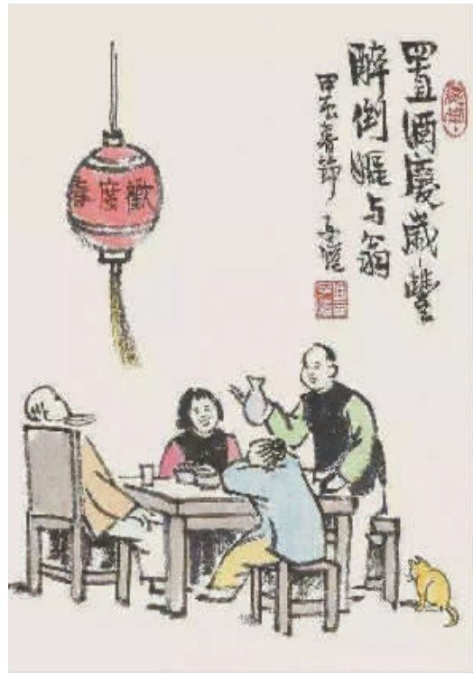
置酒庆岁丰 丰子恺作品