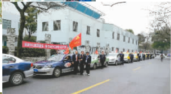
▲上海的士雷锋车队