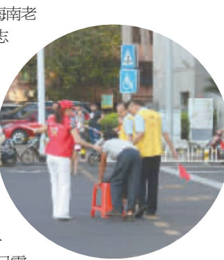
斑马线处的感人一幕

昨日,海南省义工互助协会、海南省陶义工社、海南义家义工、帮帮志愿者们一同在海口75个交通路口开展文明交通疏导志愿服务活动。