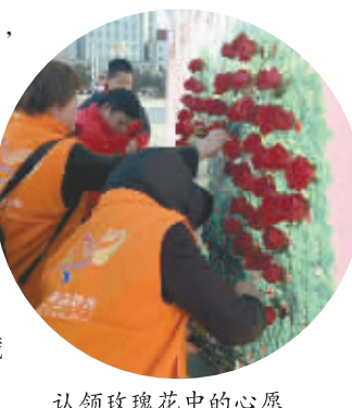
认领玫瑰花中的心愿

“赠人玫瑰,手留余香”,昨日,国华准格尔电厂携手准格尔义工协会开展了“花香心愿、爱满人间,做新时代的新雷锋”志愿服务。在准格尔厂场上,一块愿愿树展板上有200支玫瑰,每一支上面都有两张纸条,一张为“学雷锋”宣传语,一张为“愿望单”。成都晚报记者了解到,这些玫瑰花里藏着当地200名特困学生的心愿。