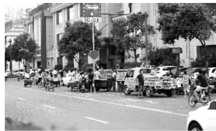
益州大道南段商贩占道

日前,一位署名为“一位关心城市的市民”投诉,高新区益州大道1918号附近与天府新区交界处,每天有商贩违法占道经营,货车、三轮车占据非机动车道后,非机动车被“逼”上机动车道,存在安全隐患,影响城市形象。这位市民反映,大家一投诉,高新区城管工作人员来了,小摊贩跑去另一边的天府新区继续叫卖,高新区的城管就在这边看着;如果天府新区城管工作人员来了,小摊贩又跑到高新区去,天府新区的城管在那边看着。这位市民希望给这些小摊贩划一个合理的地方买卖,不要在主干道上做生意,还城市一片安宁。