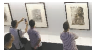
市民欣赏李可染画作

李可染曾师从林风眠、法籍画家克罗多专攻西画;又师从齐白石、黄宾虹,深入中国书画艺术之堂奥。作为一代书画大家,李可染与