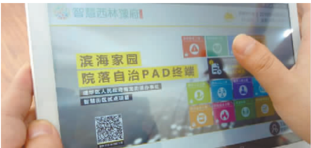
居民演示反映社区问题的过程

打开平板电脑上的滨海家园APP,常见的社区问题分类模块出现在最显眼的位置,以环境卫生类问题为例,点击该分类模块后,系统随即依次跳转到点选小区、楼栋单元、门号等信息的页面,最后点击“确认”键,